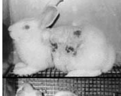
参考 左は捨てられ処分される犬 右は薬物を皮膚に塗られたウサギ(いずれもイメージ)

武田薬品は、鎌倉市と藤沢市にまたがる住宅密集地の目と鼻の先に 巨大な動物実験場と動物火葬場を建設しようとしています 当対策連絡会は、動物実験に関し公衆衛生上の問題を重視し 武田薬品がこれまでのように企業秘密とするのではなく、 住民に与える精神的な影響や保険衛生上の影響を明らかにするよう 自治体である市議会や市長への請願、要望を通して要求しています 武田薬品の新研究所で何が行われるのか？ 安全って本当なのか？